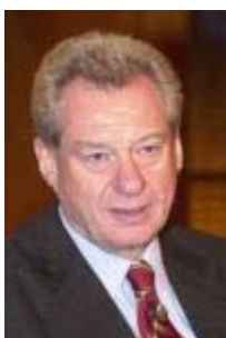
Heinrich Weiss Vorstandsvorsitzender SMS AG

Im Moment machen sie [die Koalitionspartner] doch nichts anderes, als über Zuständigkeiten und über Personen zu reden. Aber wie das [die Reformprobleme] tatsächlich gelöst werden soll, das ist doch nicht erkennbar. Und wenn beispielsweise gesagt wird, jetzt kriegen wir ein großes Superministerium, da wird Wirtschaft und Arbeit endlich zusammen gebracht, wenn da nicht klar auch definiert ist - und man das über diese Diskussion zur Koalitionsvereinbarung auch mal hört, wie denn das zusammengebracht werden soll, dann sag ich Ihnen jetzt schon, dann werden die Arbeitsmarkt-Fördermittel letztendlich versickern, ohne dass Beschäftigungseffekte dabei entstehen. Das haben wir in Thüringen, das haben wir auch in Sachsen erlebt, als die beiden zusammengelegt worden sind.