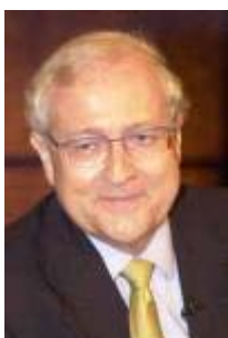
Rainer Brüderle stellv. Vorsitzender der FDP-Bundestagsfraktion

Ich würde lieber über die Frauenpolitik sprechen, für die der Herr Schröder steht und für die der Herr Stoiber steht. Und wieder haben wir diese wunderbare Alternative. Herr Stoiber schlägt vor zum Beispiel, dass jetzt ein Familiengeld eingeführt wird, 600 Euro. Ich würde sagen, das ist eine Herdprämie, um die Frauen schön zu Hause zu belassen.