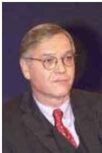
Ludolf von Wartenberg Hauptgeschäftsführer BDI

Deshalb [wegen der höheren Lebenserwartung durch bessere medizinische Versorgung] ist auch die Forderung, die Ausgaben im Gesundheitswesen zu drosseln, zu senken, völlig absurd. Die müssen steigen, wenn die Bevölkerung immer älter wird und wenn der medizinische Fortschritt so rasant geht. Wir werden meines Erachtens die Rentenprobleme nur lösen können mit einer Verlängerung der Arbeitszeit. Das muss natürlich flexibel gestaltet werden. Wer durch körperlich schwere Arbeit mit 50 Jahren ruiniert ist, der muss mit 50 Jahren gehen. Und es muss auch möglich sein, dass jemand, der körperlich leistungsfähig ist, auch über 65 arbeitet. Da brauchen wir also wesentlich mehr Flexibilität. Aber im Schnitt wird die Arbeitszeit verlängert.