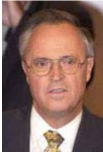
Hans Eichel Bundesfinanzminister, SPD

Es ist keine sehr kluge Entscheidung, wieso eigentlich die Vorsitzenden einer Partei nicht im Bundestag sitzen dürfen oder Bundestagsabgeordnete nicht Vorsitzende der Partei sein dürfen - wo in der Tat für eine Bundespartei die Musik eben hier in Berlin spielt. Das lässt sich nur aus der Geschichte der Grünen erklären. Aber ich glaube nicht, dass das die Grünen stärkt. Es wird sie eher schwächen.