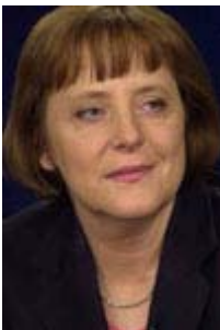
Angela Merkel CDU-Vorsitzende

Ich selbst habe auch meinen Wahlkreis in Mecklenburg-Vorpommern und da weiß man ja, was alles geschaffen wurde, wie lange das gedauert hat und wie schwer es die Selbstständigen auch haben. Es ist schon dramatisch für viele, weil es unendlich viel Kraft, unendlich viel Elan gekostet hat. [...] Jetzt wieder diese Ungewissheit. Das Leben nach der Wende war ja schon für viele mit soviel Neuerungen verbunden, mit soviel Ungewissheiten, und ich bin deshalb auch besonders beeindruckt, dass viele in den anderen Neuen Bundesländern unglaublich solidarisch sind. [...] Wir haben