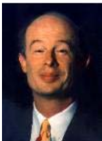
Hans-Joachim Schellnhuber Klimafolgenforscher