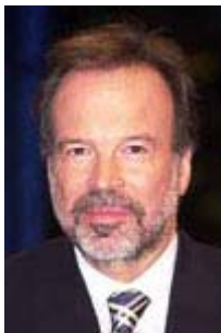
Prof. Norbert Walter Chefökonom Deutsche Bank