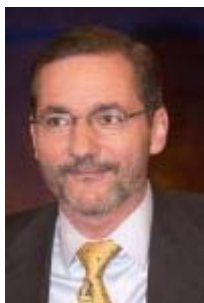
Matthias Platzeck Ministerpräsident Brandenburg, SPD

Ich glaube, es ist schon so etwas wie eine historische Zäsur passiert an diesem 22. September, die aber Ergebnis eines Prozesses ist [...]. Sie [die PDS] soll Stimme