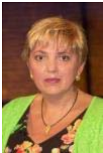
Claudia Roth Bundesvorsitzende B'90/Die Grünen

Es gibt Dinge, die gehören zum Grundkonsens der Demokratie und die dürfen nicht in den Wahlkampf.