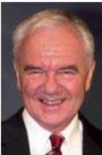
Manfred Stolpe Ministerpräsident Brandenburg a.D., SPD

Ich bin sehr froh, dass endlich mal offen über die Arbeitslosigkeit im Osten geredet wird.