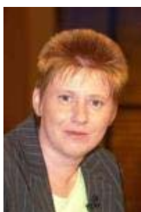
Petra Pau stellv. PDS-Vorsitzende