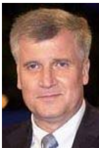
Horst Seehofer Stellvertretender CSU-Chef

Ich bin ja nicht erst seit einem Jahr in der Politik, sondern seit über 20 Jahren. Und ich glaube ohnehin, dass man jetzt nicht mit mir eine große Vorstellung machen muss, sondern wir werden bei meiner Präsentation auch ein inhaltliches Konzept für Renten, Gesundheit und Arbeitslosenhilfe präsentieren.