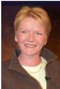
Gabriele Zimmer Parteivorsitzende, PDS

Eines der eigentlichen Probleme insbesondere für die alten Bundesländer ist, dass wir in der Tat eine Menge Beamte haben - so wie Herr Späth mal einer war - , dass wir diese Pensionen jetzt für diese Beamten zahlen müssen Und dass nur wenige, nämlich die Angestellten und Arbeiter, die gesamte Last tragen für die Renten, für die Arbeitslosigkeit. Deshalb würde ich gerne mit Ihnen gemeinsam [zu Herrn Späth] und dafür braucht man eine Zweidrittelmehrheit im Bundestag dafür sorgen, dass wir hier solidarischer sind, dass auch Beamte ihren Beitrag leisten, dass wir damit nicht nur die ganze Last bei den Angestellten und den Arbeitern haben.