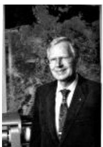
Horst Malberg Meteorologe

Ich glaube, man darf nicht automatisch eine Erwärmung mit einer Zunahme von Katastrophen in Verbindung bringen, bzw. auf gar keinen Fall denken, dass es von