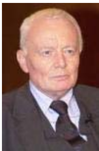
Arnulf Baring Historiker

Ich lasse die Entscheidung über Kinderbetreuung in Priorität eins bei den Eltern, das ist auch die Verfassungsgrundlage. Und dann lasse ich bei den Eltern auch genügend Geld, das wahrnehmen zu können [..] Es gibt nämlich neben der Ganztagschule auch vielleicht Eltern, die sagen, dass sie am Nachmittag sich mit ihren Kindern länger beschäftigen wollen und sie nicht nur bei anderen abgeben wollen. Auch dieses Bild ist ein Bild, das unsere Gesellschaft prägt. Sie nehmen denen aber die finanziellen Möglichkeiten dazu [...]