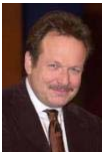
Frank Bsirske ver.di-Chef

Den Frieden kann man nur sichern - aus unserer Sicht jedenfalls - wenn man den Waffeninspektoren die Zeit gibt und die Möglichkeiten gibt, also auch das nötige Druckpotential gibt, das man braucht, damit der Diktator auch mit diesen Waffenkontrolleuren zusammenarbeitet. Wenn man sich hier aus der Solidarität oder aus der Gemeinschaft der Vereinten Nationen heraus begibt, indem man sich vorfestlegt, ohne dass man die Ergebnisse der Kontrolleure kennt, dann nimmt man diesen notwendigen Druck und das ist das Gefährliche dabei. Es ist leider so, dass hier in Deutschland eine Diskussion geführt wird, nach dem Motto, es gibt in der Weltpolitik zu viel Amerika. Ich glaube es gibt in der Weltpolitik zu wenig Europa. Mehr Europa wäre das Bessere und das wird nur gelingen, wenn wir uns in der Völkergemeinschaft mit den Vereinten Nationen darüber verständigen können, dass auch die Vereinten Nationen das Gewaltmonopol haben.