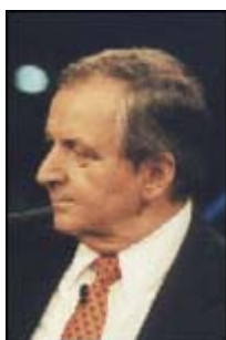
Klaus Töpfer UN-Generaldirektor für Umwelt

Menschen verursachte Ursachen hat. Es ist unbestritten, dass es seit 1850 wärmer geworden ist. Es ist auch unbestritten, dass die Orkantiefs im nordatlantisch/ europäischen Bereich zugenommen haben. Es ist nur aus meteorologischer Sicht nicht einsehbar, dass das auf eine, vom Menschen verursachte Erwärmung zurückzuführen ist. [...] Wenn man sich diese Temperaturdatenreihen [die 300 Jahre zurückgehen] anschaut und analysiert, dann stellt man fest, dass die 1790er Jahre in Mitteleuropa genauso warm waren wie die 1990er. 1790 sind noch alle mit der Postkutsche gefahren. Wir hatten noch keine Industrialisierung. Das heißt also, wir müssen auch eine Vielfalt von natürlichen Klimafaktoren haben, die unser Klima ständig verändern. Das Klimasystem ist komplex, und es hat immer Klimaänderungen gegeben. [...] Nach den 1790er Jahren gab es hier in Mitteleuropa einen dramatischen Temperaturrückgang bis etwa 1850. [...] Das Ergebnis meiner Untersuchungen ist, in den vergangenen 140 Jahren hat die gesteigerte Sonnenaktivität zwei Drittel der Erwärmungen ausgemacht und der Mensch ist in dem letzten Drittel enthalten. Das heißt, für die Vergangenheit wird - meiner Ansicht nach - der menschliche Einfluss überschätzt. Was aber nicht automatisch heißt, dass das so bleibt.