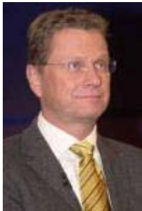
Guido Westerwelle FDP-Vorsitzender

Wir haben uns politisch nicht isoliert [mit Haltung zum Anriff auf den Irak], sondern ich glaube, dass es der klare Kurs ist der rot-grünen Regierung, dass wir inzwischen auch in den europäischen Nachbarstaaten, in der amerikanischen Bevölkerung sehr viel Zustimmung haben in dem Versuch, die UN-Resolution nicht militärisch umzusetzen [...] Wir machen alles das, was innerhalb der NATO-Verpflichtung von uns erwartet wird [...] Zweitens werden wir alles machen, was unterhalb einer direkten Beteiligung liegt, das heißt, wir werden auch der Türkei helfen, aber wir werden dies im Rahmen von dem tun, was auch gedeckt ist. Alles, was eine weitere Auslegung betrifft, würde bedeuten, dass man im Bundestag darüber entscheiden muss. Und ich kann nur nochmal sagen, für mich ist es keine Wahlkampffrage, sondern wir sehen die Bedenken in der Bevölkerung, in Europa, in Amerika und ich bin überzeugt, dass diese Bedenken ganz klar politisch auch auf den Punkt gebracht werden müssen. Hätten wir das nicht getan, hätten wir längst oder möglicherweise längst eine Brückierung der Vereinten Nationen.