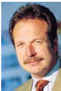
Frank Bsirske Gewerkschaftschef ver.di

Die ostdeutschen Länder sind die ärmsten Länder der ganzen Bundesrepublik. Es ist völlig ausgeschlossen, dass diese Länder eine solche Forderung [Lohnsteigerung im öffentlichen Dienst] verwirklichen, ohne massiven Personalabbau [...] Der öffentliche Dienst - Sie [zu Bsirske] - vergleichen Äpfel mit Birnen. Im Einzelhandel können sie relativ leicht Ihren Arbeitsplatz verlieren. Im öffentlichen Dienst können Sie ihn nicht verlieren. Sie sind faktisch unkündbar. Sie haben im öffentlichen Dienst nicht nur fast unkündbare Arbeitsverträge, Sie haben eine zusätzliche Versorgung im Alter, die sehr viel Geld kostet und die jedes Jahr mehr Geld kostet, die sonst niemand hat.