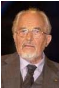
Rainer Barzel ehem. CDU-Vorsitzender

Ich habe den großen Vorteil, beide Kandidaten zu kennen. Und ich war überrascht, dass Stoiber doch recht schlagkräftig war und teilweise sehr charmant. Und ich war erfreut, dass der Bundeskanzler, dem man die Anspannung dieser Tage ansah, so sachlich blieb. [...] Wenn ich mich selbst frage, als Wähler, dann komme ich mir ein bisschen vor wie Faust bei Goethe: "Da steh ich nun, ich armer Tor und bin so klug, als wie zuvor." Denn ich kriegte ja gar keinen Wahlzettel, wo die beiden Namen