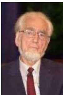
Erhard Eppler SPD-"Urgestein"

Ich wehre mich immer, wenn man sagt, dies und das gehört nicht in den Wahlkampf. Ist es denn was Schlimmes der Wahlkampf? Es ist eine Hochzeit der Demokratie! Das Gespräch derer, die ein Mandat erwerben, mit den Wählerinnen und Wählern. Da gehört alles 'rein, was die Menschen interessiert.