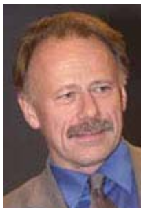
Jürgen Trittin Bundesumweltminister, Grüne

Die Unternehmen, die Gewinne machen, Körperschaften, die Gewinne machen, müssen auch etwas an Steuern zahlen. Es kann nicht so sein, dass Unternehmen Gewinne machen und keine Steuern zahlen. Deswegen müssen wir bei Verlustvortrag und seiner Anwendung eingreifen wie das international üblich ist. Oder ich sage ausdrücklich: Aktiengewinne sind Einkommen und müssen besteuert werden. Das ist übrigens schon so mit einer einjährigen Frist bei uns - es muss auch durchgesetzt werden. Nun kommt das Thema Vermögens- oder Erbschaftssteuer. Da lehne ich mich deswegen relativ unbeteiligt zurück, Frau Christiansen. Es ist eine Ländersteuer. Es gibt im Bundesrat keine Mehrheit dafür.