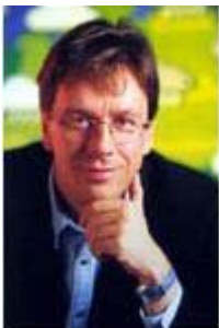
Jörg Kachelmann Meteorologe

In Deutschland sind wir sicherlich nicht führend, was die Warnung vor Naturkatastrophen angeht. Das hat angefangen am Sonntag, als der staatliche Wetterdienst, der eigentlich zuständig ist für solche Warnungen, dummerweise nur eine Vorwarnung zu einer Unwetterwarnung herausgegeben hat. Die hatte eine Fußnote, in der drinstand, dass es noch zu früh sei, genaueres zu sagen und dass später etwas genaueres käme. Am Montag haben wir vom MDR- und ARD-Wetterstudio aus geschrieben, dass es eine Katastrophe ungeahnten Ausmaßes