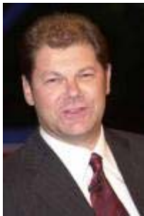
Olaf Scholz designierter SPD-Generalsekretär

Die Bundesregierung hat sich vorgenommen - und wir haben uns vorgenommen für die Koalitionsverhandlungen, - dass es keine Steuererhöhungen geben wird und dabei bleibt es auch. Natürlich gibt es jetzt eine breite Debatte. Was das Verfassungsorgan Bundesrat mit einer gemeinsamen Entschließung von CDU-Ministerpräsidenten und sozialdemokratischen Ministerpräsidenten und einer Ministerpräsidentin eventuell beschließt, können wir in den