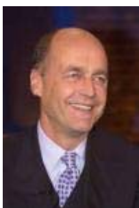
Laurenz Meyer CDU-Generalsekretär

Ich glaube nämlich in der Tat, dass aus vielen rechtlichen Gründen der Spielraum beim Familiensplitting viel kleiner ist, als das unser Koalitionspartner sich das gegenwärtig noch vorstellt. Und das werden wir deshalb auch im Einzelnen diskutieren.