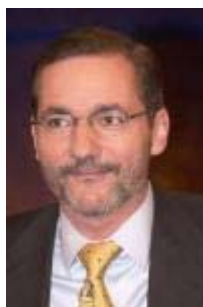
Matthias Platzeck Ministerpräsident Brandenburg, SPD

Ich glaube, es ist schon so etwas wie eine historische Zäsur passiert an diesem 22. September, die aber Ergebnis eines Prozesses ist [...]. Sie [die PDS] soll Stimme des Ostens sein, hat sie sich selber titulierte, Ostvertreter sein, allein die Interessen artikulieren können. Und da merken jetzt viele, dass sie es erstens nicht alleine ist, [...] inzwischen machen das andere mindestens so gut. Zweitens, kommen viele Menschen zu der Erkenntnis, wenn man wirklich für den Osten etwas tun will substantiell, dann geht das nur im gesamtdeutschen Rahmen, das geht nicht mehr nur als Regionalvertretung.