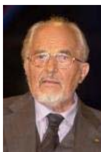
Rainer Barzel ehem. CDU-Vorsitzender

Ich habe den großen Vorteil, beide Kandidaten zu kennen. Und ich war überrascht, dass Stoiber doch recht schlagkräftig war und teilweise sehr charmant. Und ich war erfreut, dass der Bundeskanzler, dem man die Anspannung dieser Tage ansah, so sachlich blieb. [...] Wenn ich mich selbst frage, als Wähler, dann komme ich mir ein bisschen vor wie Faust bei Goethe: "Da steh ich nun, ich armer Tor und bin so klug, als wie zuvor." Denn ich kriegte ja gar keinen Wahlzettel, wo die beiden Namen