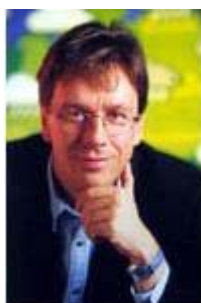
Jörg Kachelmann Meteorologe

In Deutschland sind wir sicherlich nicht führend, was die Warnung vor Naturkatastrophen angeht. Das hat angefangen am Sonntag, als der staatliche Wetterdienst, der eigentlich zuständig ist für solche Warnungen, dummerweise nur eine Vorwarnung zu einer Unwetterwarnung herausgegeben hat. Die hatte eine Fußnote, in der drinstand, dass es noch zu früh sei, genaueres zu sagen und dass