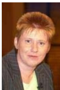
Petra Pau stellv. PDS-Vorsitzende