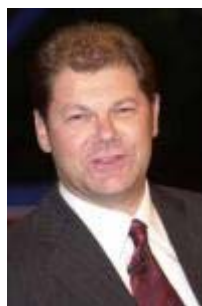
Olaf Scholz designierter SPD-Generalsekretär

Die Bundesregierung hat sich vorgenommen - und wir haben uns vorgenommen für die Koalitionsverhandlungen, - dass es keine Steuererhöhungen geben wird und dabei bleibt es auch. Natürlich gibt es jetzt eine breite Debatte. Was das Verfassungsorgan Bundesrat mit einer gemeinsamen Entschließung von CDU-Ministerpräsidenten und sozialdemokratischen Ministerpräsidenten und einer Ministerpräsidentin eventuell beschließt, können wir in den