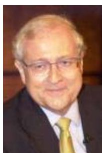
Rainer Brüderle stellv. Vorsitzender der FDP-Bundestagsfraktion

Ich würde lieber über die Frauenpolitik sprechen, für die der Herr Schröder steht und für die der Herr Stoiber steht. Und wieder haben wir diese wunderbare Alternative. Herr Stoiber schlägt vor zum Beispiel, dass jetzt ein Familiengeld eingeführt wird, 600 Euro. Ich würde sagen, das ist eine Herdprämie, um die Frauen schön zu Hause zu belassen.