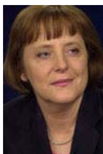
Angela Merkel CDU-Vorsitzende

Ich selbst habe auch meinen Wahlkreis in Mecklenburg-Vorpommern und da weiß man ja, was alles geschaffen wurde, wie lange das gedauert hat und wie schwer es die Selbstständigen auch haben. Es ist schon dramatisch für viele, weil es unendlich viel Kraft, unendlich viel Elan gekostet hat. [...] Jetzt wieder diese Ungewissheit. Das