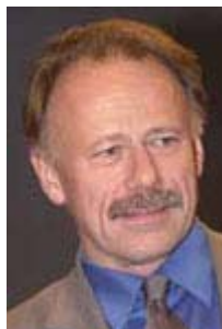
Jürgen Trittin Bundesumweltminister, Grüne

international üblich ist. Oder ich sage ausdrücklich: Aktiengewinne sind Einkommen und müssen besteuert werden. Das ist übrigens schon so mit einer einjährigen Frist bei uns - es muss auch durchgesetzt werden. Nun kommt das Thema Vermögens- oder Erbschaftssteuer. Da lehne ich mich deswegen relativ unbeteiligt zurück, Frau Christiansen. Es ist eine Ländersteuer. Es gibt im Bundesrat keine Mehrheit dafür.