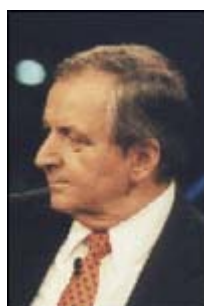
Klaus Töpfer UN-Generaldirektor für Umwelt

Ich glaube, man darf nicht automatisch eine Erwärmung mit einer Zunahme von Katastrophen in Verbindung bringen, bzw. auf gar keinen Fall denken, dass es von Menschen verursachte Ursachen hat. Es ist unbestritten, dass es seit 1850 wärmer geworden ist. Es ist auch unbestritten, dass die Orkantiefs im nordatlantisch/ europäischen Bereich zugenommen haben. Es ist nur aus meteorologischer Sicht nicht einsehbar, dass das auf eine, vom Menschen verursachte Erwärmung zurückzuführen ist. [...] Wenn man sich diese Temperaturdatenreihen [die 300 Jahre zurückgehen] anschaut und analysiert, dann stellt man fest, dass die 1790er Jahre in Mitteleuropa genauso warm waren wie die 1990er. 1790 sind noch alle mit der Postkutsche gefahren. Wir hatten noch keine Industrialisierung. Das heißt also, wir müssen auch eine Vielfalt von natürlichen Klimafaktoren haben, die unser Klima ständig verändern. Das Klimasystem ist komplex, und es hat immer Klimaänderungen gegeben. [...] Nach den 1790er Jahren gab es hier in Mitteleuropa einen dramatischen Temperaturrückgang bis etwa 1850. [...] Das Ergebnis meiner Untersuchungen ist, in den vergangenen 140 Jahren hat die gesteigerte Sonnenaktivität zwei Drittel der Erwärmungen ausgemacht und der Mensch ist in dem letzten Drittel enthalten. Das heißt, für die Vergangenheit wird - meiner Ansicht nach - der menschliche Einfluss überschätzt. Was aber nicht automatisch heißt, dass das so bleibt.