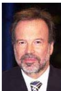
Prof. Norbert Walter Chefökonom Deutsche Bank