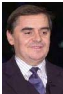
Peter Müller Ministerpräsident Saarland, CDU

[zur Bildungspolitik] Ich hätte überhaupt gar keine Hemmungen zu sagen, dass wir ein Stück weit einheitlicher im Bund planen müssen. [...] Ist das sinnig, dass wir dermaßen viele Kompetenzen völlig zersplittert im Bildungsbereich haben und der Bund hat null Kompetenzen?