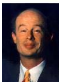
Hans-Joachim Schellnhuber Klimafolgenforscher