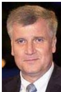
Horst Seehofer Stellvertretender CSU-Chef

Ich bin ja nicht erst seit einem Jahr in der Politik, sondern seit über 20 Jahren. Und ich glaube ohnehin, dass man jetzt nicht mit mir eine große Vorstellung machen muss, sondern wir werden bei meiner Präsentation auch ein inhaltliches Konzept für Renten, Gesundheit und Arbeitslosenhilfe präsentieren.