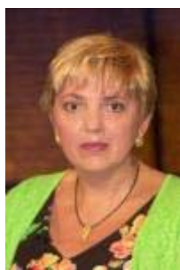
Claudia Roth Bundesvorsitzende B'90/Die Grünen

Es gibt Dinge, die gehören zum Grundkonsens der Demokratie und die dürfen nicht in den Wahlkampf.