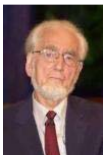
Erhard Eppler SPD-"Urgestein"

Ich wehre mich immer, wenn man sagt, dies und das gehört nicht in den Wahlkampf. Ist es denn was Schlimmes der Wahlkampf? Es ist eine Hochzeit der Demokratie! Das Gespräch derer, die ein Mandat erwerben, mit den Wählerinnen und Wählern. Da gehört alles rein, was die Menschen interessiert.