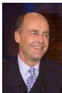
Laurenz Meyer CDU-Generalsekretär

Ich glaube nämlich in der Tat, dass aus vielen rechtlichen Gründen der Spielraum beim Familiensplitting viel kleiner ist, als das unser Koalitionspartner sich das gegenwärtig noch vorstellt. Und das werden wir deshalb auch im Einzelnen diskutieren.