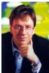
Jörg Kachelmann Meteorologe

In Deutschland sind wir sicherlich nicht führend, was die Warnung vor Naturkatastrophen angeht. Das hat angefangen am Sonntag, als der staatliche Wetterdienst, der eigentlich zuständig ist für solche Warnungen, dummerweise nur eine Vorwarnung zu einer Unwetterwarnung herausgegeben hat. Die hatte eine Fußnote, in der drinstand, dass es noch zu früh sei, genaueres zu sagen und dass später etwas genaueres käme. Am Montag haben wir vom MDR- und ARD-Wetterstudio aus geschrieben, dass es eine Katastrophe ungeahnten Ausmaßes