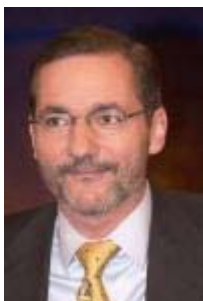
Matthias Platzeck Ministerpräsident Brandenburg, SPD

Ich glaube, es ist schon so etwas wie eine historische Zäsur passiert an diesem 22. September, die aber Ergebnis eines Prozesses ist [...]. Sie [die PDS] soll Stimme