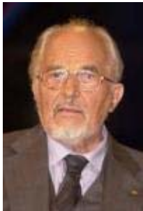
Rainer Barzel ehem. CDU-Vorsitzender

Ich habe den großen Vorteil, beide Kandidaten zu kennen. Und ich war überrascht, dass Stoiber doch recht schlagkräftig war und teilweise sehr charmant. Und ich war erfreut, dass der Bundeskanzler, dem man die Anspannung dieser Tage ansah, so sachlich blieb. [...] Wenn ich mich selbst frage, als Wähler, dann komme ich mir ein bisschen vor wie Faust bei Goethe: "Da steh ich nun, ich armer Tor und bin so klug, als wie zuvor." Denn ich kriegte ja gar keinen Wahlzettel, wo die beiden Namen