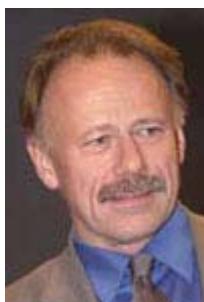
Jürgen Trittin Bundesumweltminister, Grüne

Die Unternehmen, die Gewinne machen, Körperschaften, die Gewinne machen, müssen auch etwas an Steuern zahlen. Es kann nicht so sein, dass Unternehmen Gewinne machen und keine Steuern zahlen. Deswegen müssen wir bei Verlustvortrag und seiner Anwendung eingreifen wie das international üblich ist. Oder ich sage ausdrücklich: Aktiengewinne sind Einkommen und müssen besteuert werden. Das ist übrigens schon so mit einer einjährigen Frist bei uns - es muss auch durchgesetzt werden. Nun kommt das Thema Vermögens- oder Erbschaftssteuer. Da lehne ich mich deswegen relativ unbeteiligt zurück, Frau Christiansen. Es ist eine Ländersteuer. Es gibt im Bundesrat keine Mehrheit dafür.