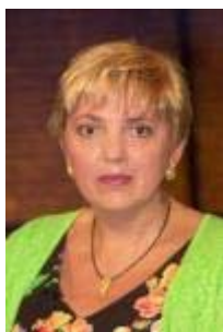
Claudia Roth Bundesvorsitzende B'90/Die Grünen

Es gibt Dinge, die gehören zum Grundkonsens der Demokratie und die dürfen nicht in den Wahlkampf.