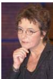
Angelika Beer Parteivorsitzende Bündnis 90/Die Grünen

Das Entscheidende ist doch, dass Deutschland Einfluss hat auf europäische und internationale Entscheidungsfindung [...] Und den Vorwurf, den ich Ihnen [zu Angelika Beer] und Ihrer Koalition mache ist, dass wir uns aus dieser Solidarität zurückgezogen haben und dass Sie eben Deutschland in eine solche Isolierung gebracht haben, dass wir gar keinen Einfluss mehr ausüben können und das ist schlimmer als eine guten Einfluss ausüben zu können.