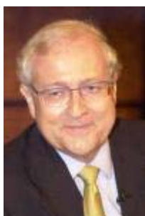
Rainer Brüderle stellv. Vorsitzender der FDP-Bundestagsfraktion

Ich würde lieber über die Frauenpolitik sprechen, für die der Herr Schröder steht und für die der Herr Stoiber steht. Und wieder haben wir diese wunderbare Alternative. Herr Stoiber schlägt vor zum Beispiel, dass jetzt ein Familiengeld eingeführt wird, 600 Euro. Ich würde sagen, das ist eine Herdprämie, um die Frauen schön zu Hause zu belassen.