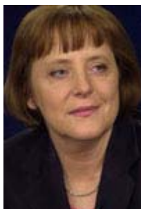
Angela Merkel CDU-Vorsitzende

Ich selbst habe auch meinen Wahlkreis in Mecklenburg-Vorpommern und da weiß man ja, was alles geschaffen wurde, wie lange das gedauert hat und wie schwer es die Selbstständigen auch haben. Es ist schon dramatisch für viele, weil es unendlich viel Kraft, unendlich viel Elan gekostet hat. [...] Jetzt wieder diese Ungewissheit. Das Leben nach der Wende war ja schon für viele mit soviel Neuerungen verbunden, mit soviel Ungewissheiten, und ich bin deshalb auch besonders beeindruckt, dass viele in den anderen Neuen Bundesländern unglaublich solidarisch sind. [...] Wir haben