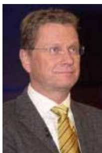
Guido Westerwelle FDP-Vorsitzender

Wir haben uns politisch nicht isoliert [mit Haltung zum Anriff auf den Irak], sondern ich glaube, dass es der klare Kurs ist der rot-grünen Regierung, dass wir inzwischen auch in den europäischen Nachbarstaaten, in der amerikanischen Bevölkerung sehr viel Zustimmung haben in dem Versuch, die UN-Resolution nicht militärisch umzusetzen [...] Wir machen alles das, was innerhalb der NATO-Verpflichtung von uns erwartet wird [...] Zweitens werden wir alles machen, was unterhalb einer direkten Beteiligung liegt, das heißt, wir werden auch der Türkei helfen, aber wir werden dies im Rahmen von dem tun, was auch gedeckt ist. Alles, was eine weitere Auslegung betrifft, würde bedeuten, dass man im Bundestag darüber entscheiden muss. Und ich kann nur nochmal sagen, für mich ist es keine Wahlkampffrage, sondern wir sehen die Bedenken in der Bevölkerung, in Europa, in Amerika und ich bin überzeugt, dass diese Bedenken ganz klar politisch auch auf den Punkt gebracht werden müssen. Hätten wir das nicht getan, hätten wir längst oder möglicherweise längst eine Brückierung der Vereinten Nationen.