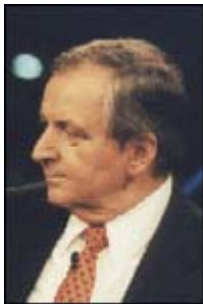
Klaus Töpfer UN-Generaldirektor für Umwelt

Menschen verursachte Ursachen hat. Es ist unbestritten, dass es seit 1850 wärmer geworden ist. Es ist auch unbestritten, dass die Orkantiefs im nordatlantisch/ europäischen Bereich zugenommen haben. Es ist nur aus meteorologischer Sicht nicht einsehbar, dass das auf eine, vom Menschen verursachte Erwärmung zurückzuführen ist. [...] Wenn man sich diese Temperaturdatenreihen [die 300 Jahre zurückgehen] anschaut und analysiert, dann stellt man fest, dass die 1790er Jahre in Mitteleuropa genauso warm waren wie die 1990er. 1790 sind noch alle mit der Postkutsche gefahren. Wir hatten noch keine Industrialisierung. Das heißt also, wir müssen auch eine Vielfalt von natürlichen Klimafaktoren haben, die unser Klima ständig verändern. Das Klimasystem ist komplex, und es hat immer Klimaänderungen gegeben. [...] Nach den 1790er Jahren gab es hier in Mitteleuropa einen dramatischen Temperaturrückgang bis etwa 1850. [...] Das Ergebnis meiner Untersuchungen ist, in den vergangenen 140 Jahren hat die gesteigerte Sonnenaktivität zwei Drittel der Erwärmungen ausgemacht und der Mensch ist in dem letzten Drittel enthalten. Das heißt, für die Vergangenheit wird - meiner Ansicht nach - der menschliche Einfluss überschätzt. Was aber nicht automatisch heißt, dass das so bleibt.