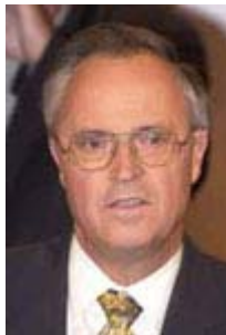
Hans Eichel Bundesfinanzminister, SPD

Es ist keine sehr kluge Entscheidung, wieso eigentlich die Vorsitzenden einer Partei nicht im Bundestag sitzen dürfen oder Bundestagsabgeordnete nicht Vorsitzende der Partei sein dürfen - wo in der Tat für eine Bundespartei die Musik eben hier in Berlin spielt. Das lässt sich nur aus der Geschichte der Grünen erklären. Aber ich glaube nicht, dass das die Grünen stärkt. Es wird sie eher schwächen.