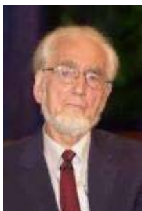
Erhard Eppler SPD-"Urgestein"

Ich wehre mich immer, wenn man sagt, dies und das gehört nicht in den Wahlkampf. Ist es denn was Schlimmes der Wahlkampf? Es ist eine Hochzeit der Demokratie! Das Gespräch derer, die ein Mandat erwerben, mit den Wählerinnen und Wählern. Da gehört alles 'rein, was die Menschen interessiert.