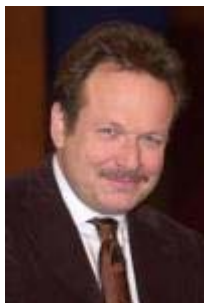
Frank Bsirske ver.di-Chef

Den Frieden kann man nur sichern - aus unserer Sicht jedenfalls - wenn man den Waffeninspektoren die Zeit gibt und die Möglichkeiten gibt, also auch das nötige Druckpotential gibt, das man braucht, damit der Diktator auch mit diesen Waffenkontrolleuren zusammenarbeitet. Wenn man sich hier aus der Solidarität oder aus der Gemeinschaft der Vereinten Nationen heraus begibt, indem man sich vorfestlegt, ohne dass man die Ergebnisse der Kontrolleure kennt, dann nimmt man diesen notwendigen Druck und das ist das Gefährliche dabei. Es ist leider so, dass hier in Deutschland eine Diskussion geführt wird, nach dem Motto, es gibt in der Weltpolitik zu viel Amerika. Ich glaube es gibt in der Weltpolitik zu wenig Europa. Mehr Europa wäre das Bessere und das wird nur gelingen, wenn wir uns in der Völkergemeinschaft mit den Vereinten Nationen darüber verständigen können, dass auch die Vereinten Nationen das Gewaltmonopol haben.